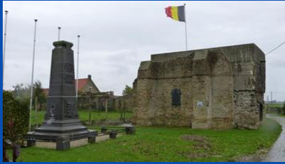
Belgische Voorpostbunker WO I