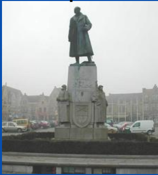
Standbeeld van Generaal Jacques WO I