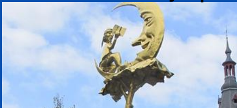
'T manneke uit de mane